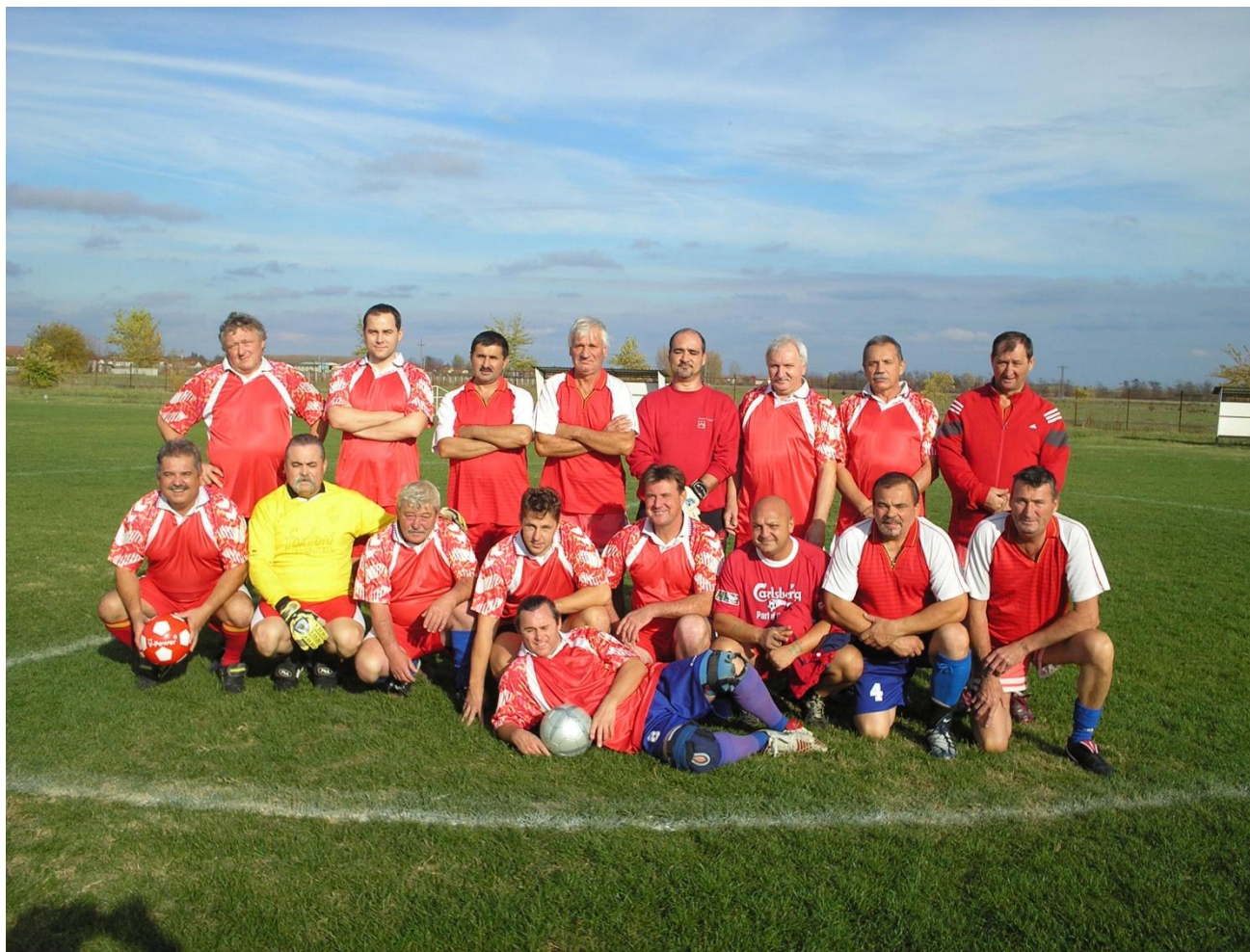
Hosszúpályi Öregfiúk csapata.

Játszott 9 mérkőzést, 7 győzelem, 0 döntetlen, 2 vereség, elért pontszám: 21, 1. helyezés